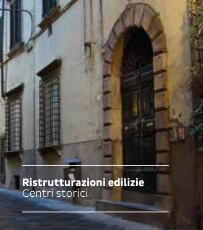
Ristrutturazioni edilizie Centri storici