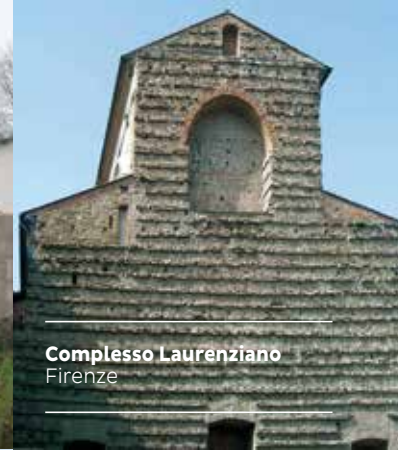
Complesso Laurenziano Firenze