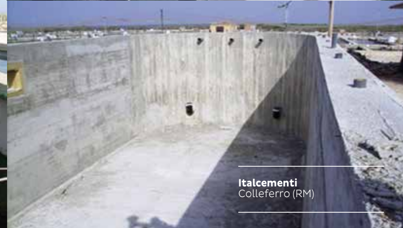
Italcementi Colleferro (RM)