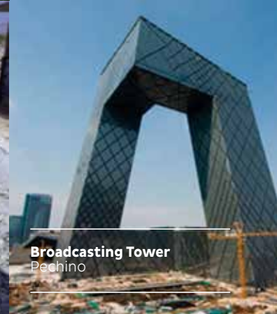
Broadcasting Tower Bechino