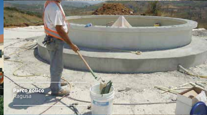
Parco eolico Ragusa