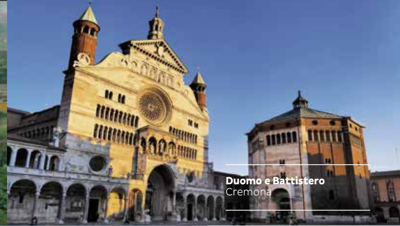
Duomo e Battistero Cremona