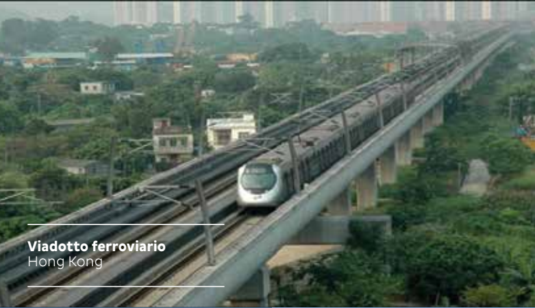
Viadotto ferroviario Hong Kong