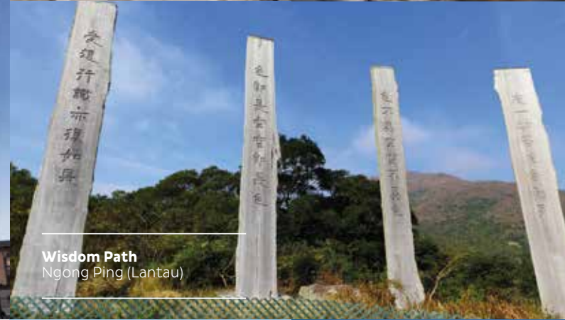
Wisdom Path Ngong Ping (Lantau)