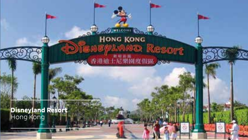
Disneyland Resort Hong Kong