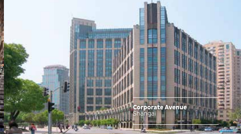
Corporate Avenue Shanghai