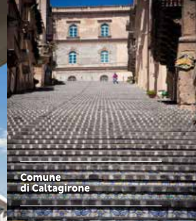
Comune di Caltagirone