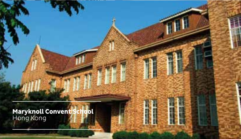
Maryknoll Convent School Hong Kong