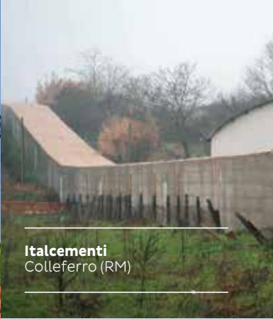
Italcementi Colleferro (RM)