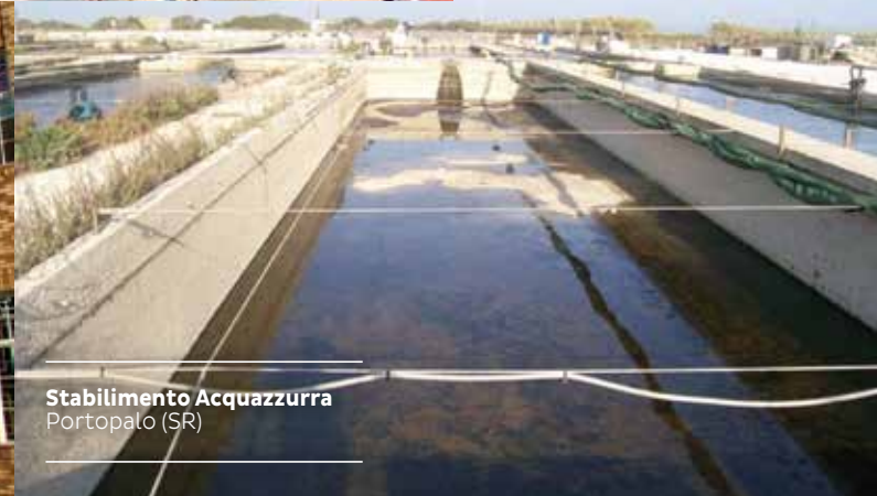
Stabilimento Acquazzurra Portopalo (SR)